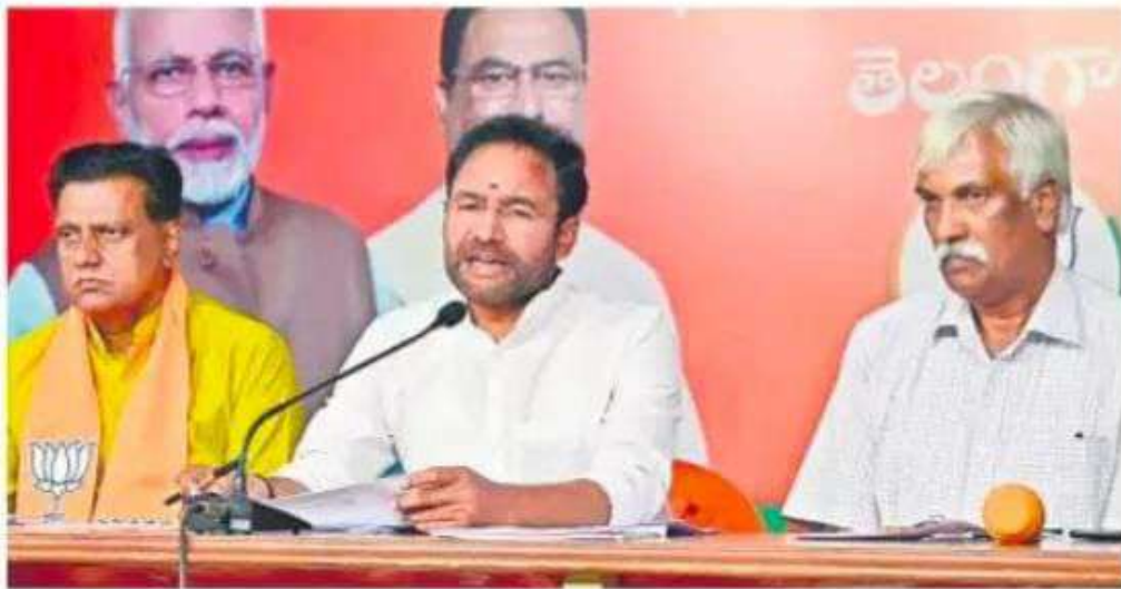
బీజేపీ స్టేట్ ఆఫీసులో మీడియాతో మాట్లాడుతున్న కేంద్ర మంత్రి కిషన్ రెడ్డి

ప్రతి నెలా మూడో వారంలో ఉద్యోగాల భర్తీకి నోటిఫికేషన్: కిషన్ రెడ్డి