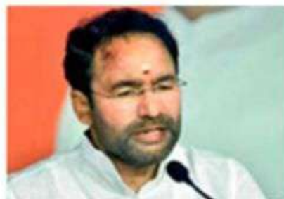
Union tourism minister G. Kishan Reddy addresses the media at the BJP office.

untla family insults our soldiers, our country and compares our economy to that of Pakistan and Sri Lanka. Anyone with even minimal intelligence and understanding knows that India has been peaceful, thanks to the Narendra Modi government. There are no terror