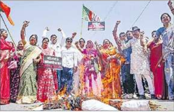
అన్ని రాష్ట్రాల్లో ప్రస్తుత సీట్లను 50% పెంచే ఫార్ములాను మోడీ సర్కారు రూపొందించింది. 'జనాభా ప్రాతిపదికన' నష్టం జరగకుండా ఈ ఫార్ములా మేలు చేకూర్చుతుంది. కానీ విపక్షాల తీరుతో దక్షిణాదికి అన్యాయం జరిగింది.

దాదాపు 3 దశాబ్దాలుగా ఈ బిల్లును తీసుకురావాలని, మహిళా లోకానికి సాధికారత కల్పించాలని చర్యచర్యలు జరుగుతున్నప్పటికీ, కాంగ్రెస్, వారి మిత్రపక్షాలు దీన్ని అడ్డుకున్నాయి. 1996లో దేవేగౌడ హయాంలో... ఆ తర్వాత 1998, 1999, 2002లో వాజ్ పేయి ప్రధానిగా ఉన్న సమయంలో ఈ బిల్లును కాంగ్రెస్ అడ్డుకుంది. ఎన్డీయే ఒత్తిడితో యూపీఏ హయాంలో 2008-10 మధ్యలో ఈ బిల్లును ప్రవేశపెట్టినా, తమ మిత్రపక్షాలతో కలిసి ముందుకు సాగకుండా చేసిన చరిత్ర కాంగ్రెస్ ది.